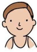
raya al lado